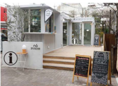
▲まちなかインフォメーション & ソフトクリーム

概要: 未利用市有地を利用し、インフォメーションセンターとカフェ機能を持つ施設の運営・管理事業を行っている。当法人がデザイン・設計した豊田市設置のコンテナを当法人が借り受け、地元女性達が運営している。まちなか情報発信と来街者へのおもてなしとともに、ソフトクリームやドリンク等地元素材を用いた特徴的なテイクアウトフードを販売。